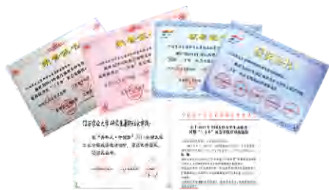
研究生暑期社会实践活动连续获得国家和省级奖励