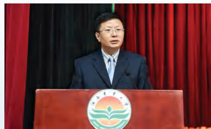
赵小敏校长，教授，博士生导师，享受国务院政府特殊津贴专家、新世纪百千万人才工程、全国模范教师