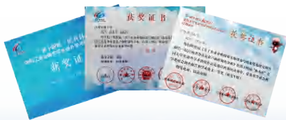
研究生在“挑战杯”全国和省级比赛中获得佳绩