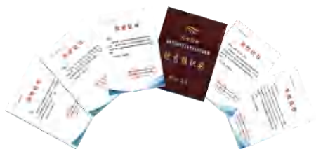
研究生在第一届全国农林院校研究生学术科技作品竞赛获得佳绩